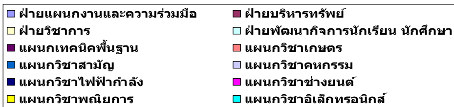
กราฟแสดงอัตราส่วนการจัดสรร งบปม โครงการ 2561